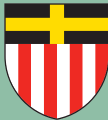
Commune de Corsier